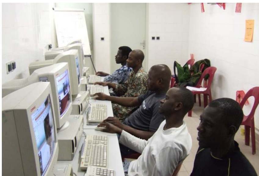
Une séance de cours informatique au foyer Bisson

L'apprentissage de l'outil informatique doit notamment permettre aux résidents, en particulier aux plus jeunes, de favoriser une éventuelle recherche d'emploi ou d'évoluer dans l'emploi qu'ils occupent, d'avoir accès à l'information et de pouvoir communiquer de façon plus efficace.