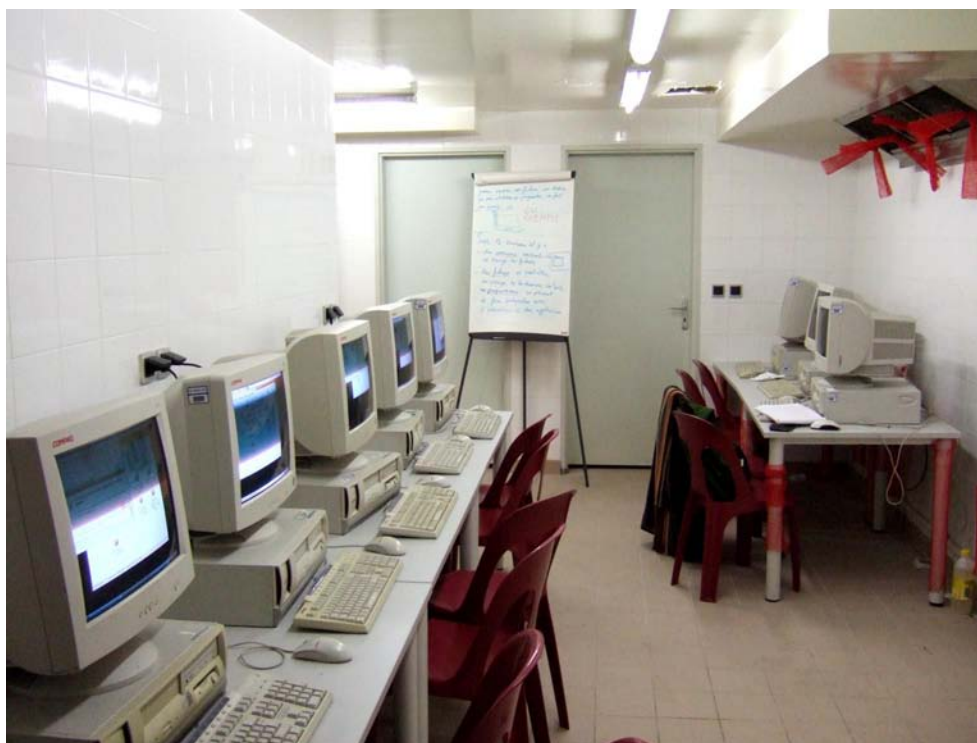
La salle informatique du foyer Bisson